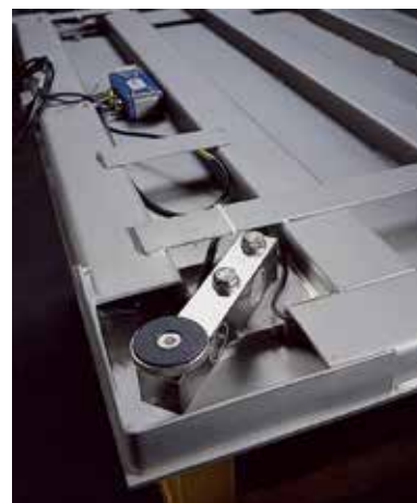
Alloggiamento cella di carico (particolare)