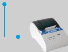
Stampante LP55 LP55 Thermal printer