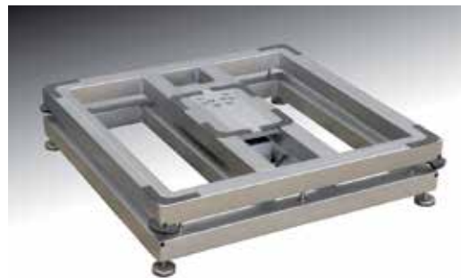
Particolare della struttura interna completamente in acciaio Inox AISI 304