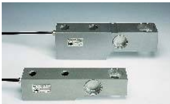
Cella di carico inox con grado di protezione IP67