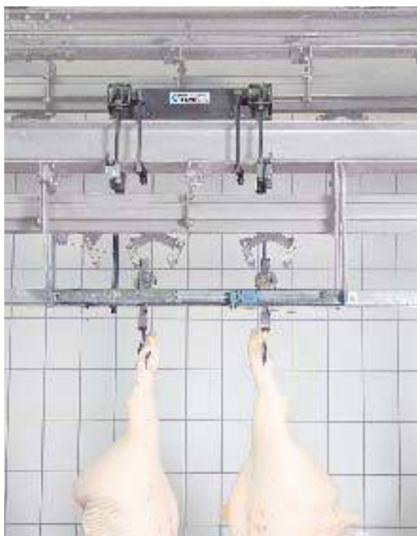
Pesatura automatica in una linea di macellazione