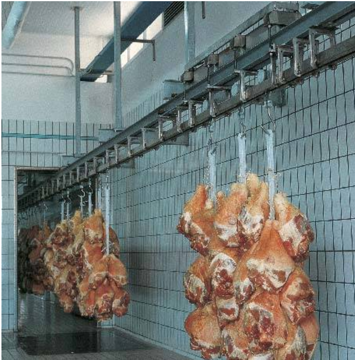
Pesetta aerea AR-TC installata in un reparto ricezione prosciutti di un moderno salumificio